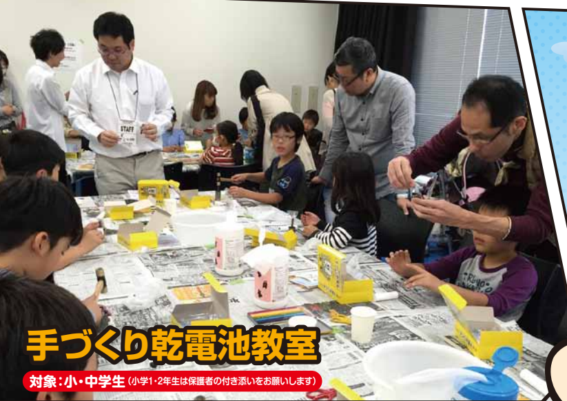
手づくり乾電池教室